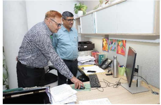
उप महाप्रबंधक (मा.सं.) के कार्यों का निरीक्षण