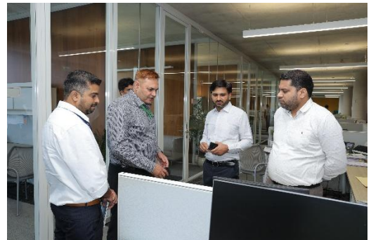
हिंदी भाषी अधिकारी के कार्यों का निरीक्षण