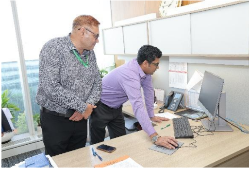
महाप्रबंधक एवं कंपनी सचिव के कार्यों का निरीक्षण

आरईसी द्वारा राजभाषा के क्षेत्र में किए जा रहे सराहनीय कार्य की समीक्षा करने हेतु उप निदेशक महोदय द्वारा विभागों का मौके पर निरीक्षण किया गया। निरीक्षण के दौरान अलग-अलग विभागों एवं अधिकारियों के कार्यस्थल पर उनके कार्यों का भौतिक निरीक्षण भी किया गया।